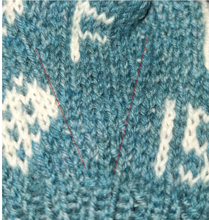
Udtagningerne ligger mellem de to røde linjer på billedet.

Når der er 16 m i tommelfingerkilen, og der efter den sidste udtagning er strikket tre omgange, hviler kilens 16 m, mens resten af vanten strikkes. På næste omgang slås 4 nye m op over tommelfingerhullet. Strik en omg. På næste omgang tages der ind over de 4 m, så de reduceres til 2 m. I alt 52 m på omgangen. I diagrammet er disse ingtagninger markeret med to små cirkler: